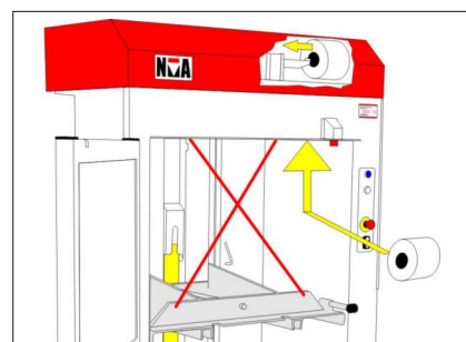
Balbanden är lätt åtkomliga framifrån. Varje band kan bytas enskilt.