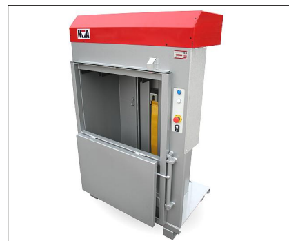
Luckan stannar som standard rakt ut men kan även fällas helt ned, anpassad efter behov.